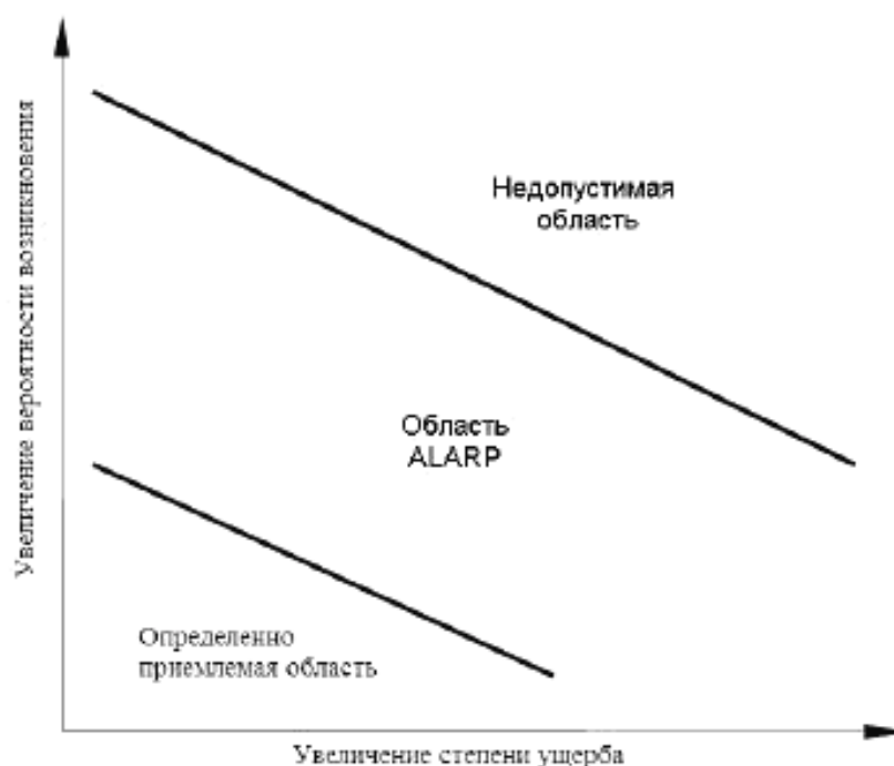
Рисунок АА.1 – Допустимость РИСКА

Если начальный РИСК является неприемлемым, то должны быть идентифицированы и приняты меры по снижению его уровня. Процесс анализа РИСКА и оценка РИСКА должны быть повторены, включая проверку, того, что принятые меры по снижению риска не внесли новые РИСКИ.