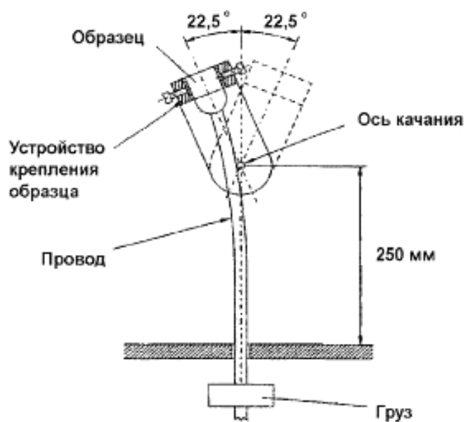
Рисунок 103 – Пример устройства для проведения испытаний на гибкость