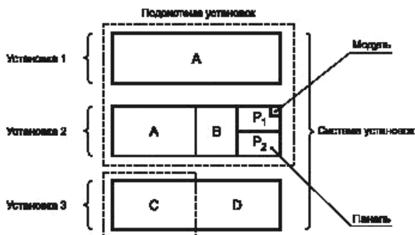
Рисунок А.1 — Элементы систем установок