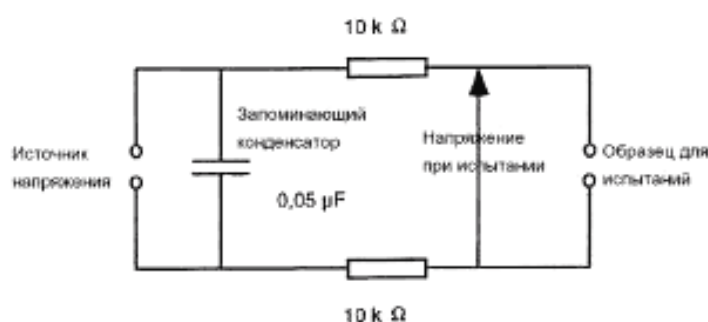
Рисунок 1 — Электрическая схема для испытания напряжением постоянного тока

Испытания напряжением постоянного тока проводят, используя схему рисунка 1.