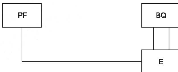
Рисунок 1 — Структурная схема измерения ослабления нежелательных резонансов для затуханий свыше 20 дБ

PF — электронно-счетный частотомер; BQ — резонатор; E — анализатор моночастотности кварцевых резонаторов с постоянным уровнем напряжения на резонаторе в измерительном мосте