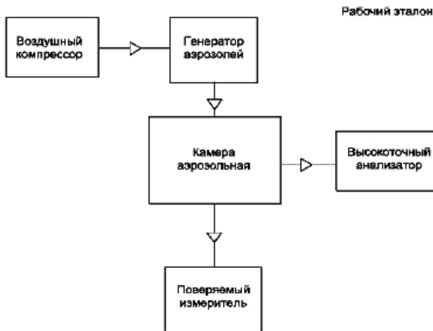
Рисунок В.2 – Структурная схема поверки ПИП массовой концентрации пыли

Рисунок В.1 – Схема подачи ГС из баллонов под давлением на ПИП объемной доли метана, кислорода, оксида углерода и диоксида углерода