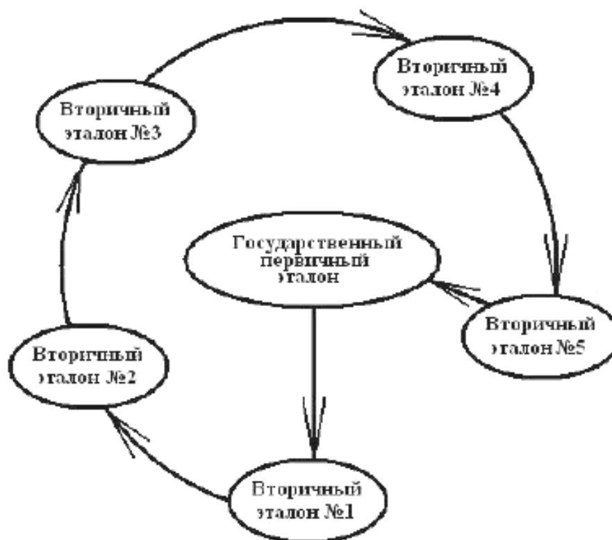
Рисунок 1 – Круговая схема процедуры сличений