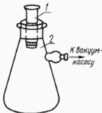
1 — тигель или воронка, стеклянные фильтрующие; 2 — колба для фильтрования под вакуумом