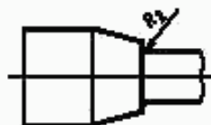
Рисунок 2 — Головка образца с переходным участком

Для спеченных изделий рекомендуется использовать образец для испытания с двумя переходными частями на каждом конце. Радиус сопряжения R_2 рабочей части с переходным участком головки образца должен быть от 1,5 до 5 мм (рисунок 2).